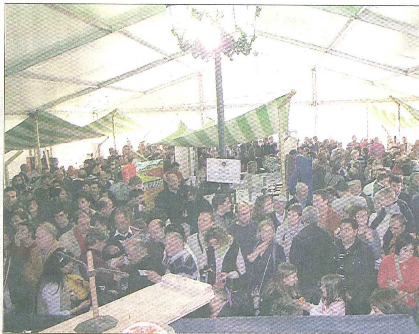
Baltanás organiza anualmente diferentes acciones agroalimentarias.

El broche de oro a Buen Rato en El Cerrato lo pondrá el concierto que ofrecerá Mayalde, a las 21 horas, en la plaza de España.